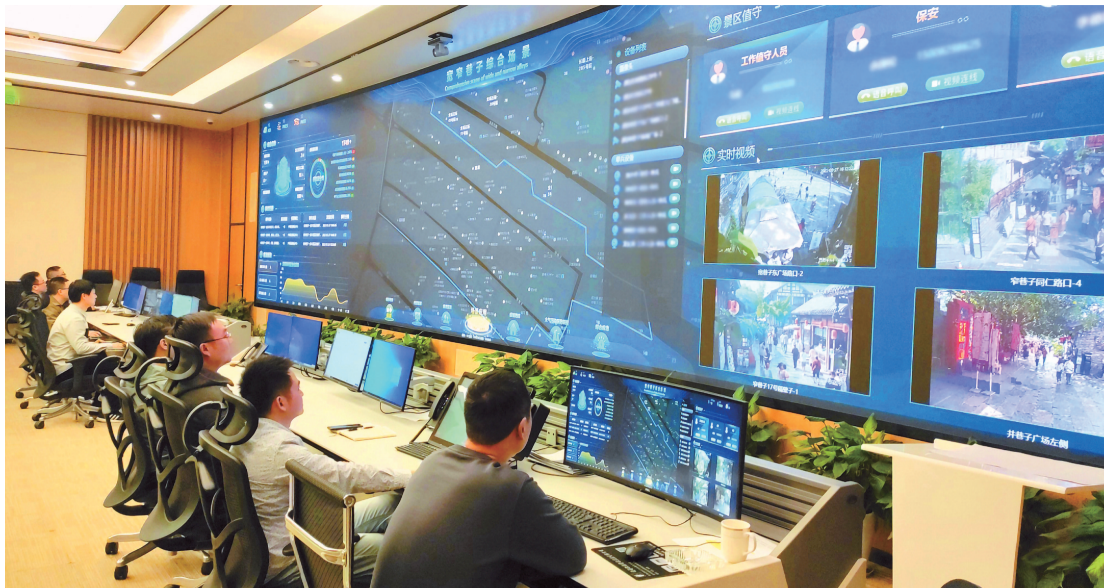
“智慧青羊”大数据中心

成 口超2000万的超大城市,对城市治理体系和治理能力现代化提出了更高要求。作为中心城区的青羊,如何推进超大城市中心城区敏捷治理、科学治理,不断增强人民群众的获得感、幸福感、安全感?青羊给出的答案是:聚焦智慧赋能,提升城市治理效能,深化“党建引领、双线融合”治理机制,让城市运转“更聪明、更智慧”,让居民生活更便利。