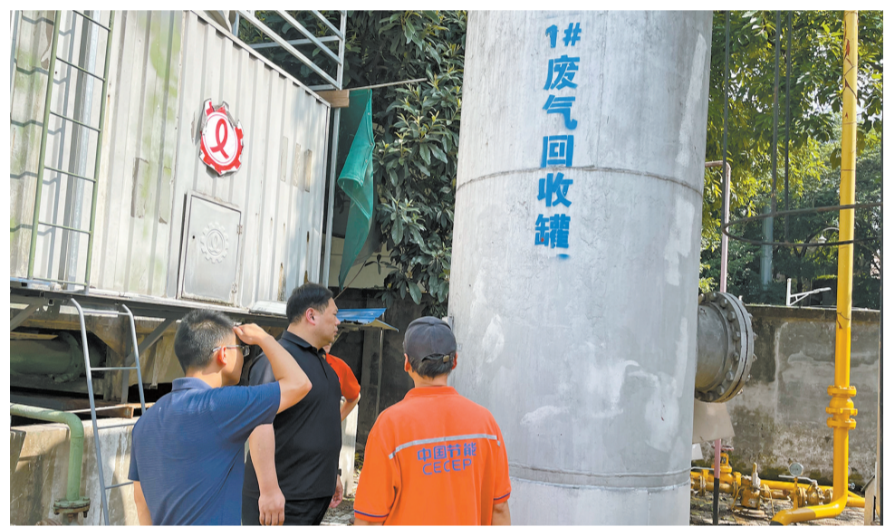
新桥街道检查废气回收罐使用情况。