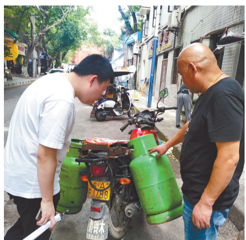
联芳街道开展燃气安全排查。