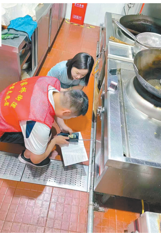
童家桥街道在餐饮店开展燃气安全示范检查。