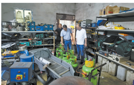
中梁镇到燃气安全重点部位开展排查整治。