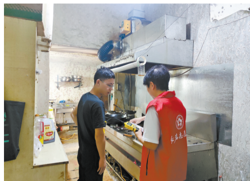
陈家桥街道深入餐饮店开展燃气检测。

6月24日，我区组织各部门、镇街和区属国有企业召开全区安全生产工作会，要求各行业部门和应急部门强化四个统筹，各镇街、管委会、区属国企拉网式全覆盖排查和宣传，提升排查整治的质量，确保排查整治有力，有效防范和化解各类安全风险，最大限度保障人民群众生命财产安全。当天上午，我区又召集全区燃气企业参加全市经信系统燃气安全隐患专项整治回头看会议，并作任务部署。同时，制定《沙坪坝区燃气安全专项整治“回头看”工作实施方案》，按镇街配备行业专家进行安全检查指导。