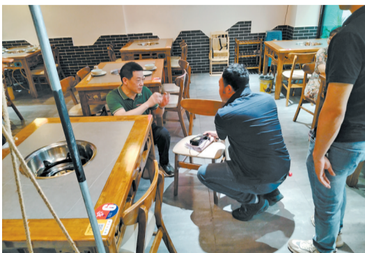
丰文街道到餐饮店宣传燃气安全知识。