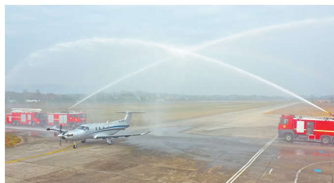
2024年1月8日，梁平至黔江通用航空短途运输航线在梁平机场正式起航，这是重庆开通的首条短途运输航线。