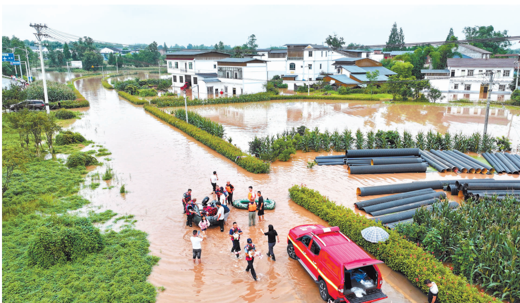
2024年7月11日，仁贤街道宏山村，公安、应急、消防等区级有关部门和仁贤街道的救灾人员在转移被困群众。