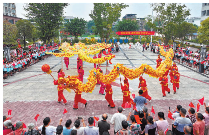
2024年9月29日，聚奎镇奎星广场，社区居民在开展舞龙舞凤活动，喜迎国庆节。