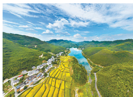
二〇二四年八月二十六日，竹山镇竹丰社区，镶嵌在群山中的村落与蓝天、青山、湖泊、稻田相映成景，构成一幅宜居宜业和美乡村新画卷。