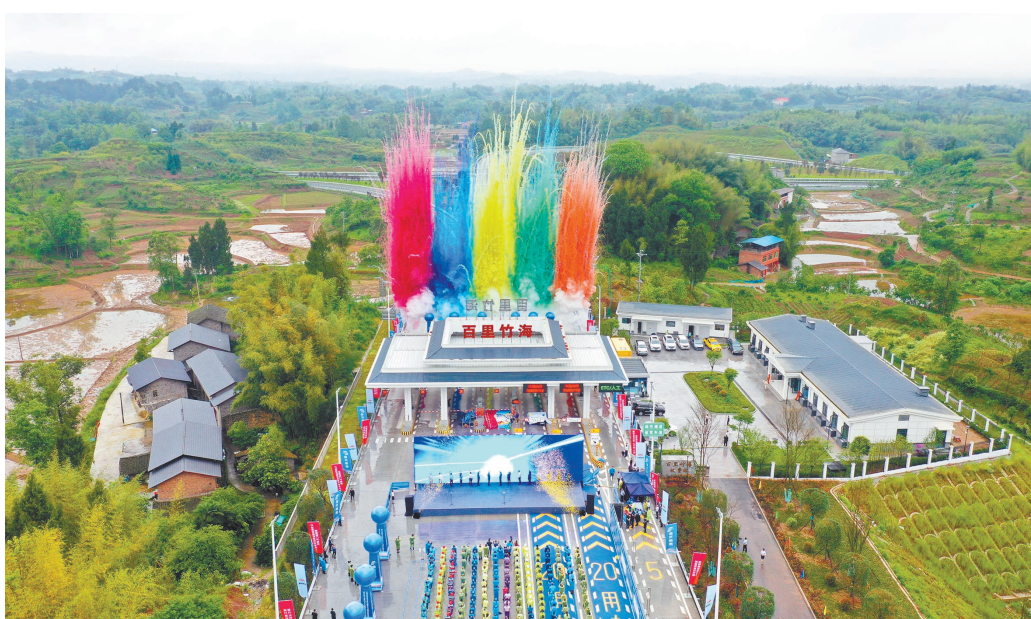
2024年4月29日，梁平区百里竹海收费站，梁平至四川开江高速公路(重庆段)通车活动举行。