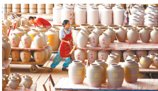
2024年6月6日，重庆天戈陶瓷有限公司，工人在用推车运输酒缸坯子。