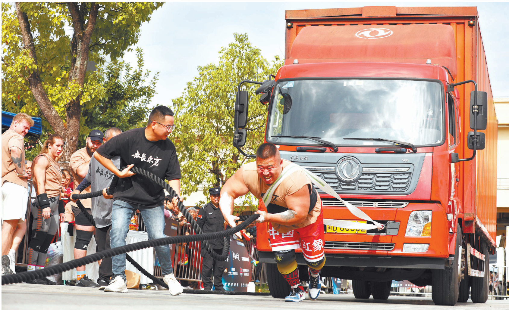
2024年10月19日，梁平区全民健身中心，2024国际湿地力王争霸赛比赛现场，参赛运动员在参加拉卡车比赛。