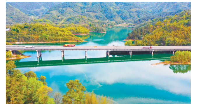
2024年3月29日，沪蓉高速公路横穿沙坝水库，与湖泊、车辆、林木、农房相映成景，构成一幅美丽的春日画卷。