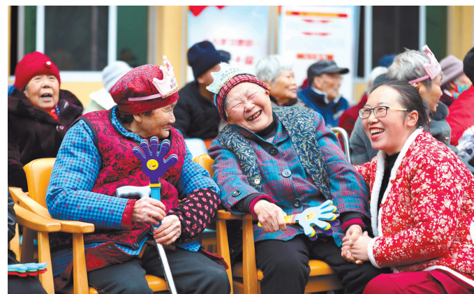
2024年11月26日，梁山街道养老服务中心，工作人员在和过集体生日的老人开心地聊天。