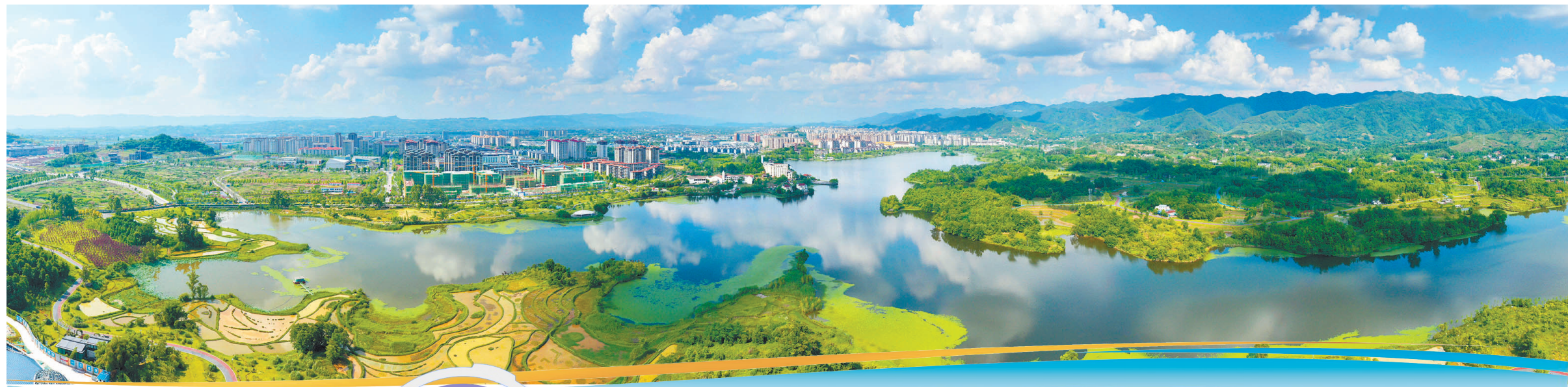
二〇二四年五月二十二日，双桂湖国家湿地公园，蓝天白云与苻菜、湖水、城市、绿地融为一体，呈现出一幅美丽的夏日画卷。