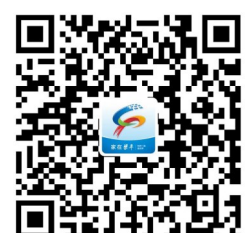
“家在梁平”新闻客户端

近年来,区检察院通过检察官兼任辖区中小学法治副校长常态化机制,创建“莎姐”检护“柚”品牌,围绕防校园欺凌、防性侵、防网络诈骗等主题定期开展送法进校园,提升未成年人保护意识。2020年以来,已累计对1.2万余名教职工进行违法犯罪记录查询,今年以来共开展了7场法治进校园活动,受教育人次近万。