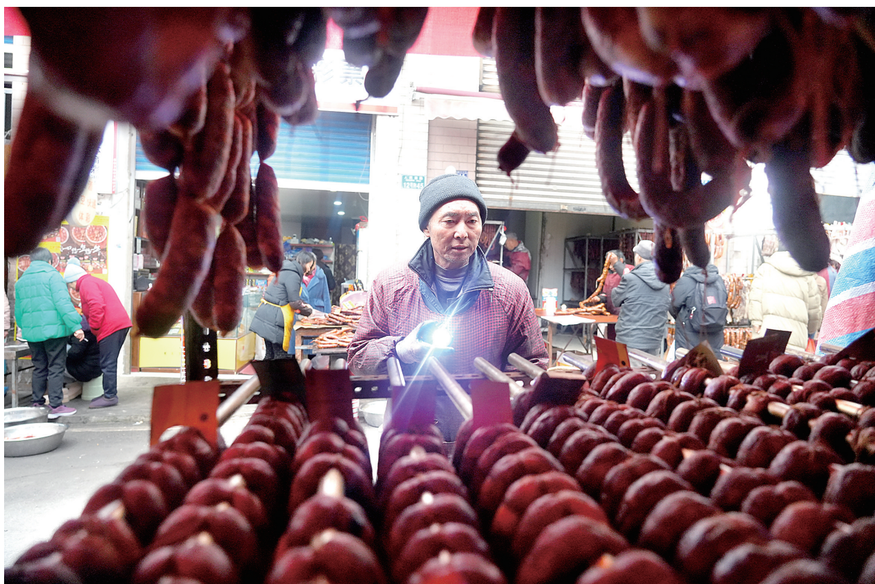
12月25日,梁山街道豆芽巷环保无烟腊制品集中熏制点,工人在查找熏制好的香肠。

据了解,今年是我区开展环保无烟腊制品集中熏制工作的第4年,各集中熏制点采取政府采购、半公益性租赁环保无烟腊制品熏制设备的方式,给全区13个熏制点配备腊制品熏制设备。每套设备包含熏箱和烟雾净化器,通过在熏制机旁连接烟雾净化器,吸走熏制腊制品时产生的水、气和烟尘,有效解决油烟污染问题。