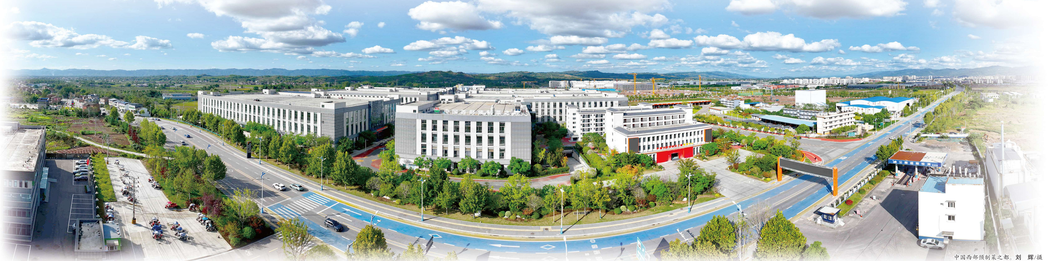
中国西部预制菜之都。刘 辉/摄

梁平,坐拥巴渝第一大平坝,拥有丰富的农业资源,是国家级重点产粮大区、全国商品粮基地、国家农产品质量安全区,享有“巴蜀粮仓”的美誉。 近年来,梁平区立足以稻子、柚子、鸭子、竹子、豆子“五子登科”为代表的丰富农产品资源优势,把预制菜产业作为“强二产、带一产、活三产”的重要抓手,主动融入全市“33618”现代制造业集群体系,举全区之力把中国西部预制菜之都打造成为预制菜产业高质量发展示范区,助推全市食品及农产品加工业高质量发展。 到2023年,梁平区预制菜全产业链企业有318家,实现产值280.16亿元,增长18.6%,其中,2023年规模以上工业预制菜产业实现产值28.2亿元,占全区规模以上工业产值比重为32.6%,成为全区工业经济发展新的引擎,成功创建百亿级农产品加工业示范园区。