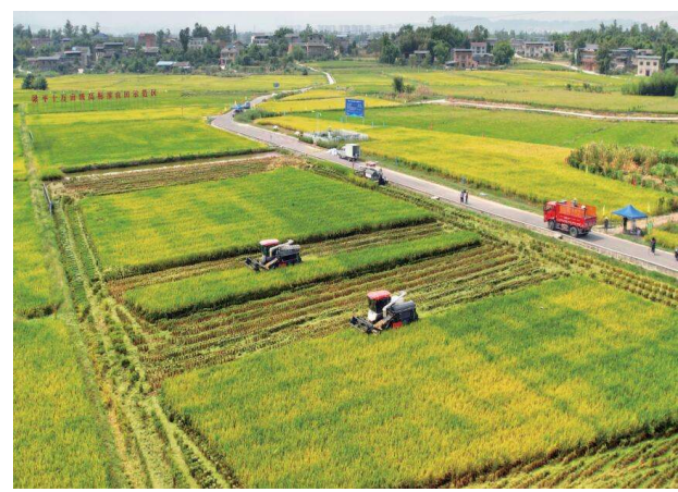
梁平享有“巴蜀粮仓”美誉,实现了水稻的优质高产。