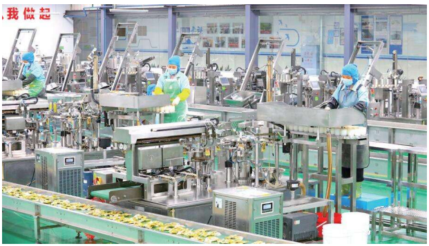
重庆上口子农业开发有限公司农产品加工生产线。

据了解,奇爽食品有限公司、真本味食品有限公司、上口子农业开发有限公司等梁平三家企业荣登赛迪网发布的2023年预制菜企业竞争力百强企业榜单。梁平预制菜产业集群被认定为2023年度重庆市中小企业特色产业集群,预制菜产业园列入重庆市特色产业基地创建名单。