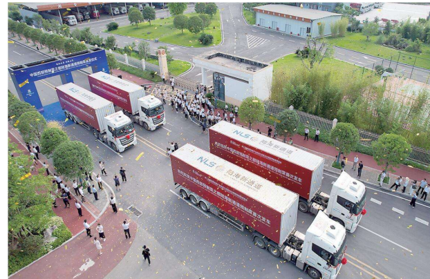
中国西部预制菜之都西部陆海新通道预制菜首发仪式现场。

今年3月,中国西部预制菜之都食品检测检验中心投入使用,可承接食品添加剂、啤酒色度、蛋白质、脂肪等13项食品参数检测,为推动预制菜产业高质量发展注入了澎湃动力。