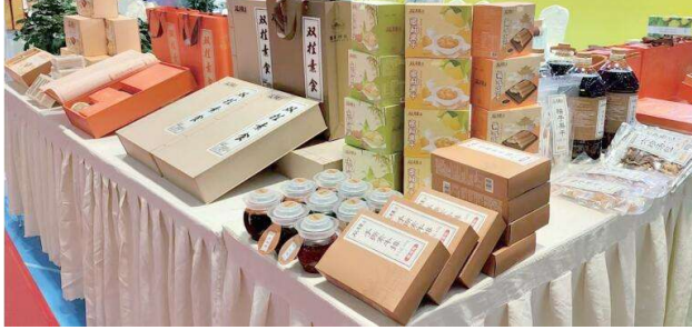
独具区域辨识度的双桂素食品牌多次亮相市内外展会。

截至目前,梁平培育国家级名老字号1个、著名商标2个、市级名牌产品9个,被中国烹饪协会授予“中国梁平预制菜美食地标城市”,重庆真本味食品成为首批千企百城,商标品牌价值提升行动的预制菜商标品牌。