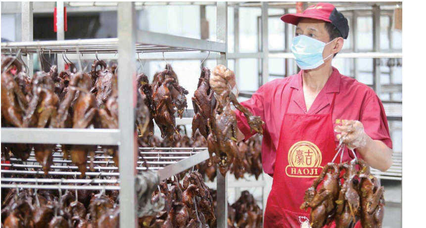
重庆真本味食品有限公司张鸭子生产线。