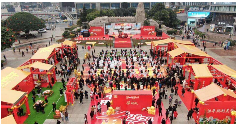
“中国年 梁平味”2024迎新消费季开季仪式暨百张鸭子新春发布会在江北观音桥商圈举行。