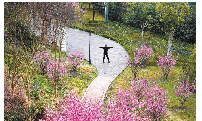
3月6日，泰和公园绿树与梅花交相辉映，市民在健身，好一幅春日美景图。