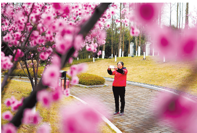
3月6日，双桂街道竹海大道，道路两旁的美人梅开得正艳，市民在拍照留念。