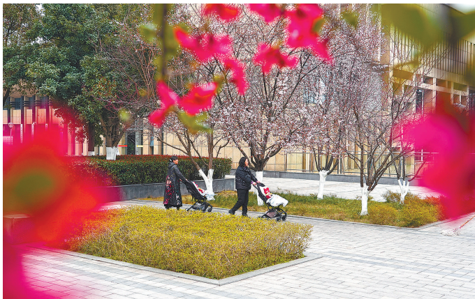
3月6日，都梁广场，海棠花与红叶李悄然绽放，市民在一边漫步，一边欣赏。