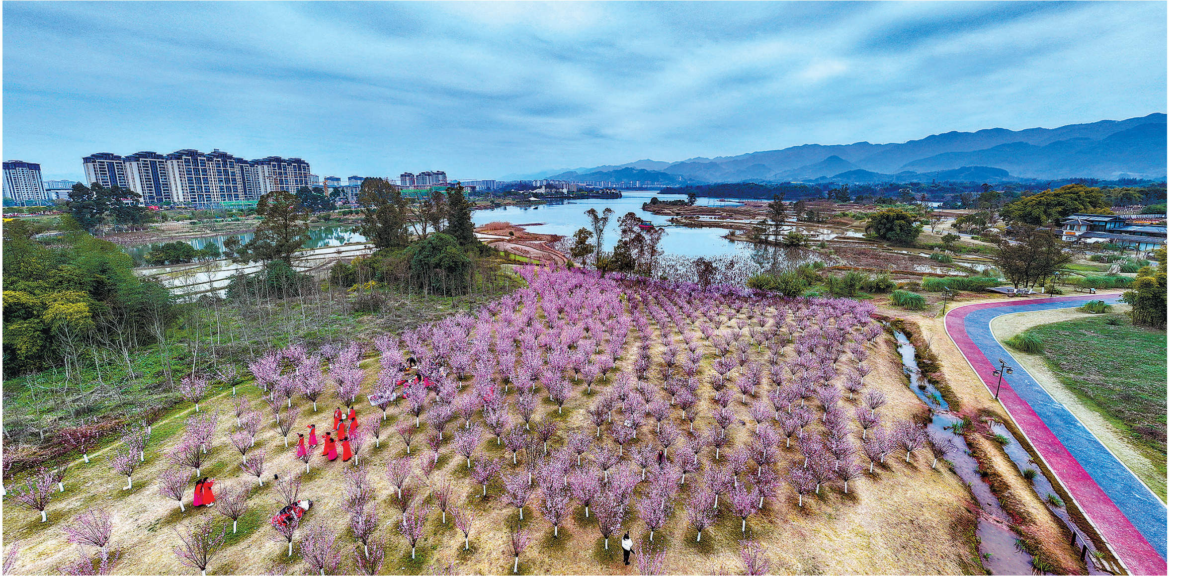
近日，双桂湖国家湿地公园，美人梅争奇斗艳，吸引不少市民前往赏花、游玩，尽享春日美景。