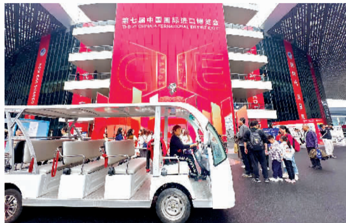
“姚姐”每天驾驶电动观光车穿行在场馆里。

障职工、媒体记者……在进博会这样的大型展会中，往来穿梭的人群，构成进博会一道亮丽的风景。如果询问他们，会发现对于他们来说，步行一两万步是家常便饭。