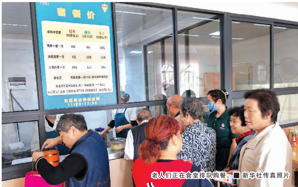
老人们正在食堂排队购餐。

企业内生动力。”汪洪峰说，为帮助企业更好地发展，民政部门积极引导企业在提供餐饮服务基础上，探索多种经营、拓展增值服务。