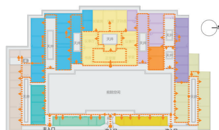
图2 游览路线图