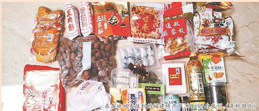
在各地网友收到的福建特产中,不少产自泉州。(资料图片)