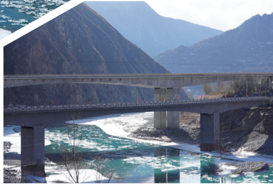
通天河上架起的桥梁造福两岸百姓

高原寒冬,长江上游干流通天河河水清澈泛蓝,河面出现流动的冰块,如一朵朵盛开在冰面上的“冰花”随意漂流,勾勒出一幅幅独属高原寒冬的别样景观。