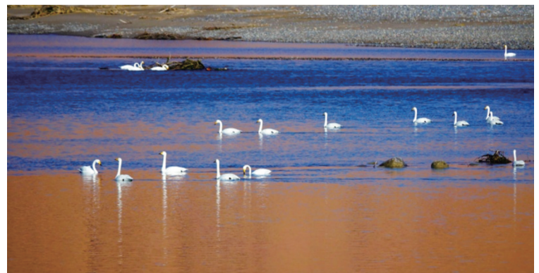
贵德境内黄河已经成为重要的天鹅冬季迁徙地