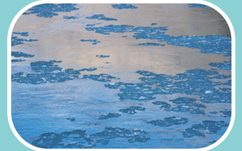
通天河面“冰花”盛开

长江当曲口至玉树市巴塘河口称通天河,长800余公里,河水在高山峡谷之间奔流不息,沿线景色壮美。同时,通天河流域还有古岩画、传统村落等,展现着三江源地区民族文化的魅力。 据人民网