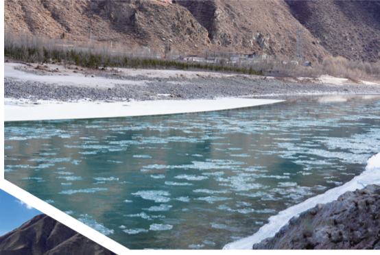
通天河面“冰花”盛开