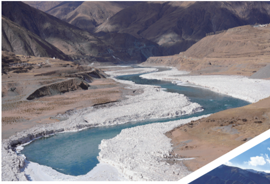
通天河在高山峡谷之间 奔流不息