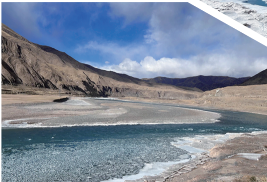
通天河蜿蜒奔流