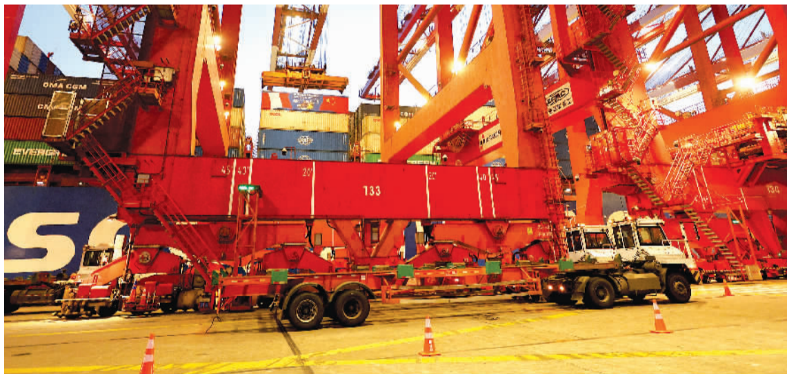
中远海运旗下“新上海”轮经过23天的航行,昨天靠泊在上海洋山港码头等待卸货。它是自秘鲁钱凯港开港后首个“钱凯—上海”正式航次,标志着从钱凯港到上海港的海运航次首次双向贯通。