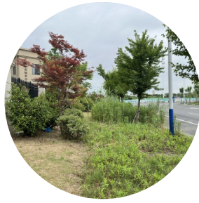
图为长满杂草的绿化带。

随后,记者与滨江尚悦花园的物业办公室取得联系,工作人员告诉记者,紧靠小区外墙一米左右的绿化带由小区物业负责养护,前段时间已经对杂草进行了清理,另外一半绿化带则不在小区管理范围之内。随后,记者联系了滨江新区办事处康阳社区,工作人员表示,紧靠小区外墙一米的绿化带是小区养护,剩下的部分将由滨江新城公司建造人行道,相关领导已与滨江新城公