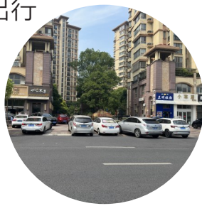
图为小区门口违停车辆。

记者联系了交警部门,工作人员表示,对于御水湾二期北门非机动车道等相关道路,交警部门一直进行常态化违停处罚管理工作,由于辖区较大,警力不足,交警部门采取巡逻管理的方式进行违停管理,因此会存在巡逻间隙,今后将继