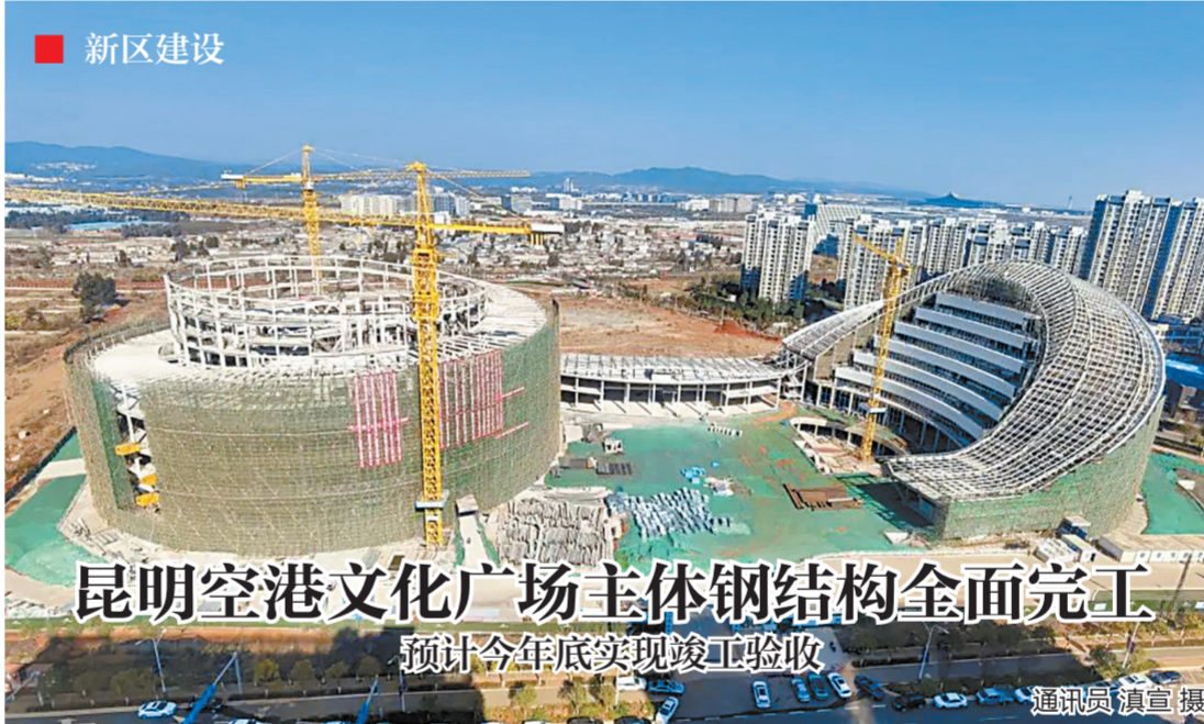
昆明空港文化广场主体钢结构全面完工 预计今年底实现竣工验收

本报讯(记者 肖永琴)日前,昆明空港文化广场项目秀场屋面网架顺利完成提升,标志着该项目15000吨主体钢结构全面完工,为昆明空港文化广场项目今年底实现竣工验收奠定坚实基础。