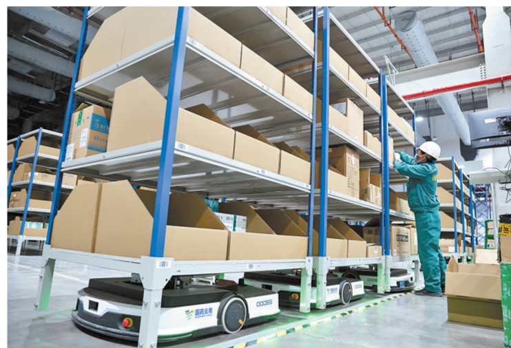
医药健康产业园内,库区作业高度自动化。物流搬运机器人用“货找人”代替了传统的“人找货”拣选模式。

在管理体制深化改革方面,滇中新区按照昆明市委、市政府制定的《云南滇中新区管理体制改