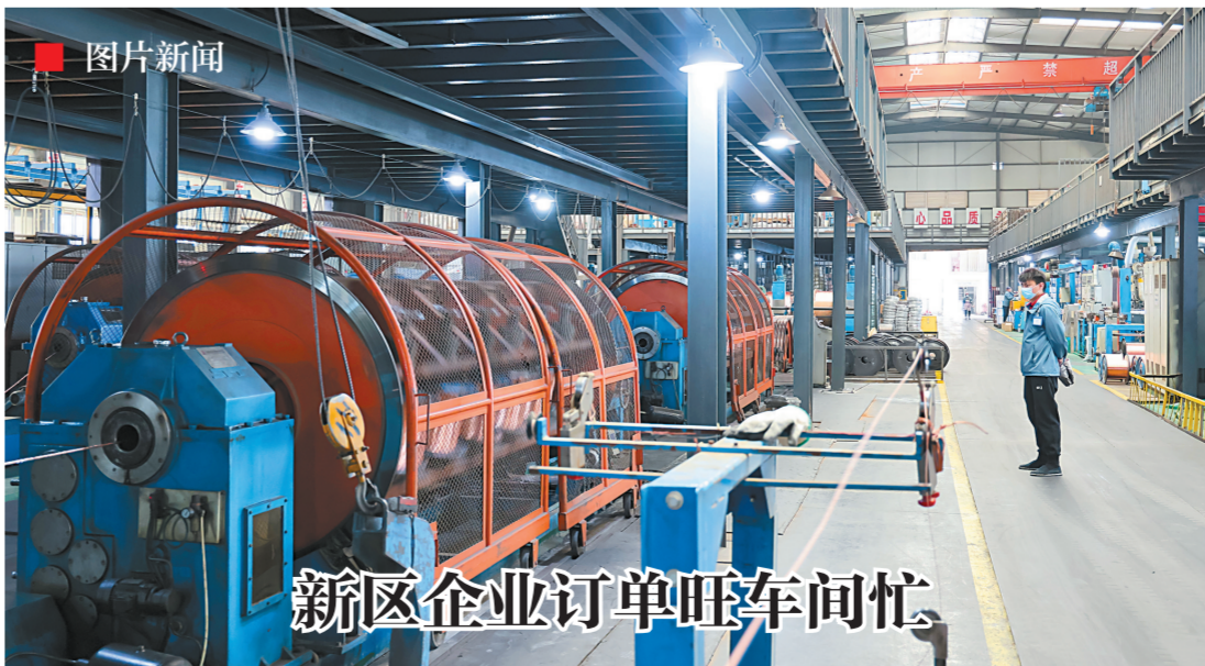
新区企业订单旺车间忙 近日,记者在滇中新区多家企业看到,工人们在生产线开足马力忙生产、赶订单,一派繁忙景象。图为昆明电线电缆有限公司工人正在赶制订单产品,确保今年第一季度“开门红”。

据悉,该项目是昆明市及滇中新区重要的集剧院演出、互动实景表演、动漫体验、亲子游、休闲度假、旅游购物、公益教育等活动于一体的互动式生态文化创意产业基地,建成后将为滇中新区的文化休闲娱乐、旅游消费升级、国内国际演艺及教育培训服务等作出重要贡献。