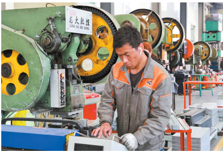
中驰三龙电力股份有限公司生产车间内复工复产忙

距离该公司不远处,同样热火朝天的生产场景在云南金伦云印实业股份有限公司生产车间也能看到:设备在工人的操作下加快运转,各条生产线不停运转各式各样的印刷品订单。“有110余人到岗,到岗率90%以上。今年新接订单量